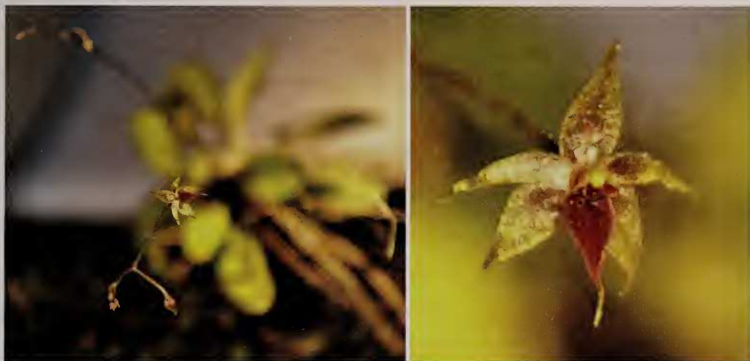
Fig. 1 : Platystele ovipositoglossa